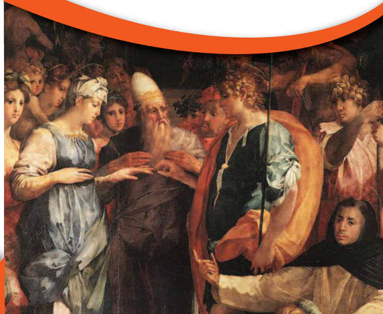
Immagine in copertina:

Giovan Battista di Jacopo, detto il Rosso Fiorentino, Sposalizio della Vergine (1523) , Firenze, Basilica di San Lorenzo.